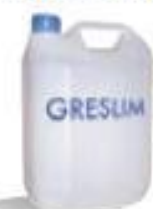
Кислотный препарат для очистки керамических материалов