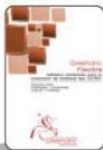
Цементный клей для керамогранита