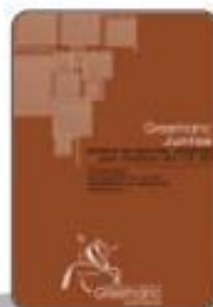
Цементная затирка для заделки швов

GRES DE LA MANCHA, SL (GRESMANC) не несет ответственности за возможные претензии, если не были выполнены инструкции по облицовке.