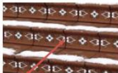
Швы (заполнение швов)